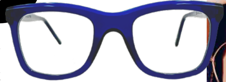
SPITTELBERG Füllige Ränder verkörpern reges Treiben, künstlerische Schöpferkraft sowie gemütliche Behaglichkeit.

Die Marke ist made in Austria, trotzdem im heimischen Markenvergleich preiswert. Jeder Kauf einer Scharfsinn-Fassung stärkt eigenständige, unabhängige Optikerbetriebe und belebt auch die heimische Wirtschaft.