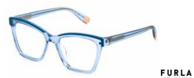
FURLA Ecken, Kanten sowie raffinierte Details an der Front führen einen unverwechselbaren Look vor Augen.