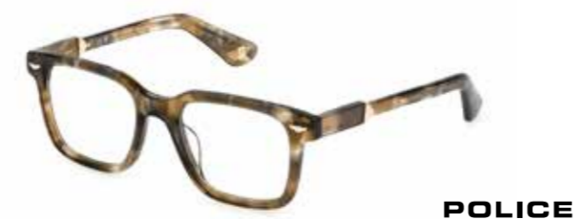
POLICE Buongiorno! Exklusives, marmoriertes Acetat trifft auf markante Proportionen in italienischem Flair.