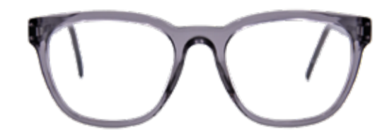
MUR Alles im Flow – der fließende Übergang in die ovale Form harmonisiert mit rundlichen wie eckigen Gesichtern.

KOSTENLOSER SEHTEST Wir bieten Ihnen einen kostenlosen Sehtest mit fachkundiger Beratung, damit Sie immer mit den richtigen Gläsern unterwegs sind. Unabhängig vom Sehtest sollte eine regelmäßige Überprüfung des allgemeinen Gesundheitszustandes der Augen bei einem Augenarzt erfolgen.