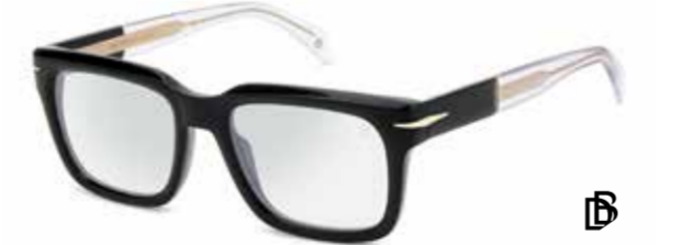
DAVID BECKHAM Die stilisierte Raute an den oberen Kanten und die Drahtkernkonstruktion an den Bügeln bezeugen David B.