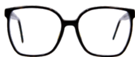
WÖRTHERSEE Volltreffer! Bühne frei für die 70er Jahre. Die weiten, quadratischen Rahmen passen perfekt zu jedem Retro-Look.