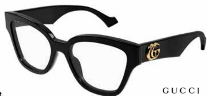
GUCCI Mit voller Wucht! Ein breites Bügeldesign demonstriert Selbstbewusstsein und verleiht pures Luxusgefühl.

Der Luxus legt eine andere Gangart ein. Selbstbestimmt, entschlossen und unbeeindruckt davon, was andere tragen. Markante Muster, Formen und Farben präsentieren sich auf dem gesamten Globus. Dabei formieren sich Frankreich und Italien als bedeutendste Knotenpunkte der Extravaganz.